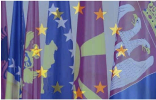
Sind Albanien, Bosnien und Herzegowina, Kosovo, Montenegro, Nordmazedonien und Serbien bereit für den Beitritt zur EU oder die EU noch nicht so weit für die Erweiterung?

Die Erweiterung ist damit aufgrund struktureller, politischer und rechtsstaatlicher Bedenken in der Europäischen Union umstritten und ein schneller EU-Beitritt des Westbalkans folglich ambitioniert. Dennoch ist ein entschlossenes und vor allem beständiges Handeln zur Unterstützung von politischen Reformen und der verstärkten Einbindung in den europäischen Binnenmarkt erforderlich, um dem Einfluss russischer und chinesischer Akteure zu begegnen. Eine vor-schnelle Aufnahme könnte die EU also von innen heraus gefährden, während weiteres Zögern langfristig zu einer Destabilisierung führen könnte. Die Europäische Union befindet sich auf einer Gradwanderung zwischen strategischer Unabhängigkeit und innerer Geschlossenheit.